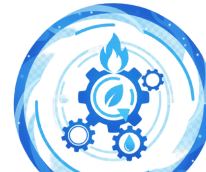
Resetea tu Metabolismo